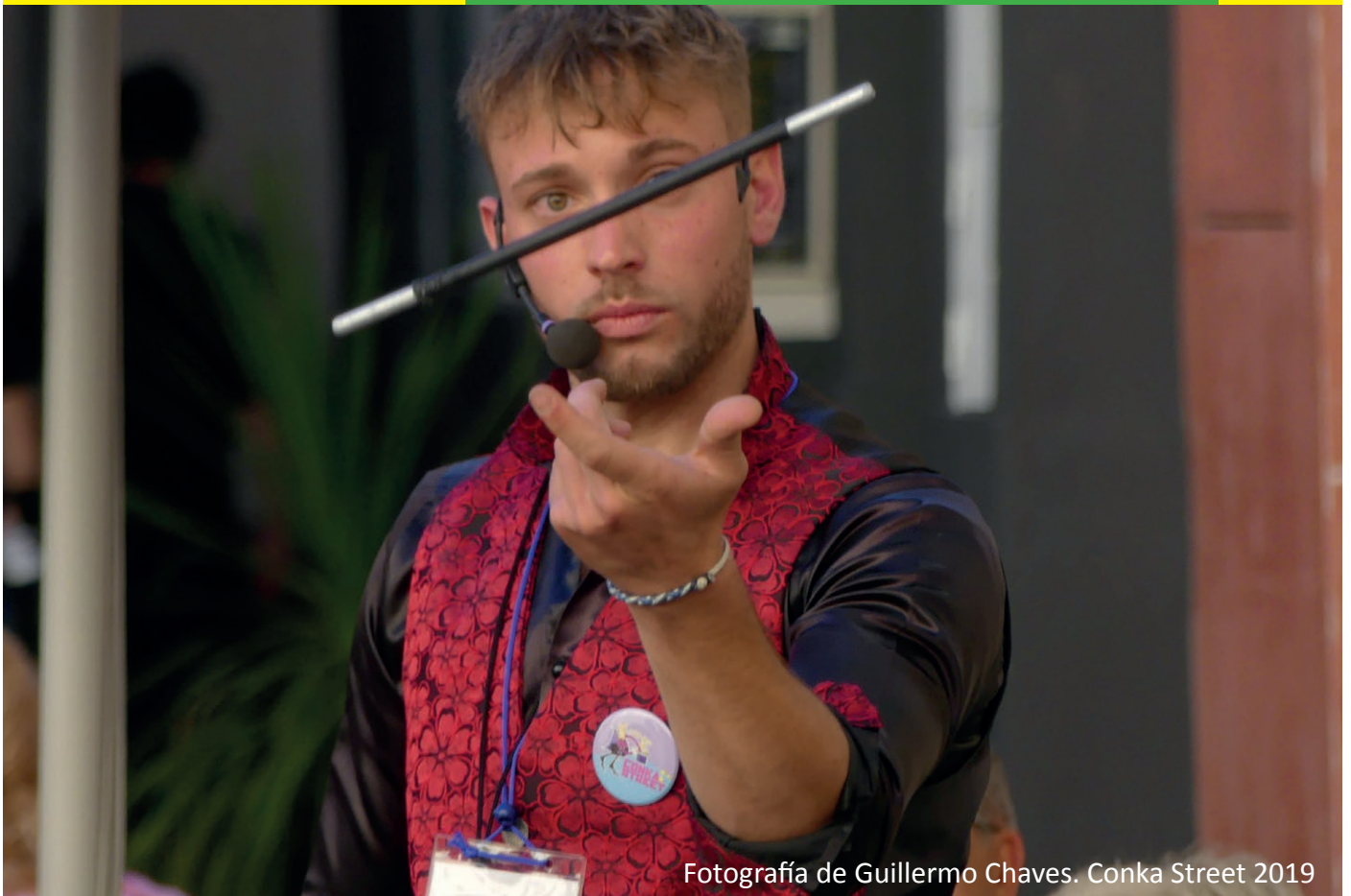
Conka Street 2019